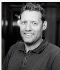
Jesper Wikander Redbergsvägen, Platågatan, Danska vägen 69-79, Pärlickaregatan, Kungälvsgatan, Brobacken.