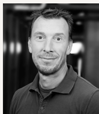
Johan Östling Utlandagatan, Mejerigatan, Anders Zornsgatan, Falkenbergsgatan.

Under hösten har några av våra fastighetsansvariga bytt områden. Du som har fått en ny kontaktperson har fått information i brevlådan. Här kan du se vem som är din kontaktperson.